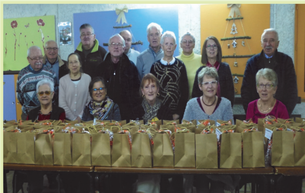
Une partie des bénévoles de Lorient et de Pontivy