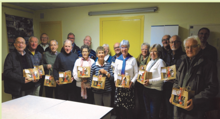
Une partie des bénévoles de Vannes et de Ploërmel