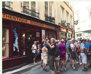
Pas de Lyon sans bouchon

Nous retrouvons ce parc magnifique qui avait enchanté les participants à la fête des lumières, il y deux saisons déjà, et ce vieux manoir dont la vétusté ne lui laissera bientôt guère de charme. Les guides sont à la hauteur et le samedi, la visite commune de Lyon et de ses traboules aura enchanté ces « géminés » si habitués à la cohabitation. Un bouchon lyonnais bien-sûr après un théâtre romain, Fourvière et sa cathédrale pour terminer sur l'avenue de La Croix Rousse si prisée des Canuts* jadis. Des façades en trompe l'œil pour tous et un musée pour nos touristes. Cette courte étape laissera, malgré tout, des bons souvenirs.