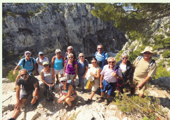
Les costauds dans les calanques de Cassis.

Vous avez dit Luberon, c'est bien là notre destination, la compagnie des guides rendra notre séjour fort agréable, des randos accessibles, un programme commun sur trois journées entre les Baux de Provence, la ville de Marseille et ses calanques, au large en bateau, et pour finir en beauté les sites d'Aubagne et de Cassis. A Cereste entre Drôme et Provence, la restauration était au top, le personnel du centre fort accueillant et les locaux fort convenables, tout était rentré dans l'ordre. Des souvenirs encore et encore de quoi affirmer que la vie est un fleuve tranquille.