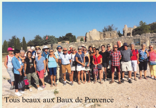
Tous beaux aux Baux de Provence