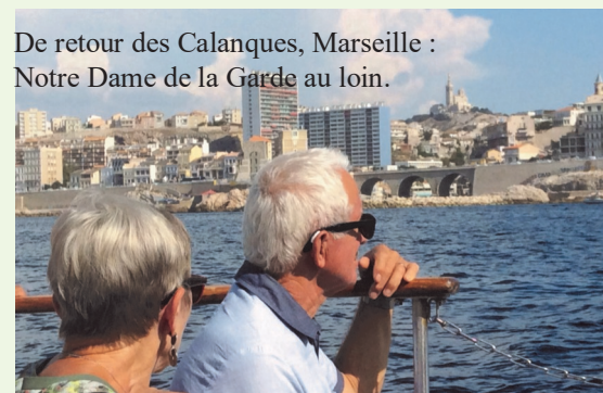
De retour des Calanques, Marseille : Notre Dame de la Garde au loin.