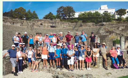
Ils sont fous ces romains !