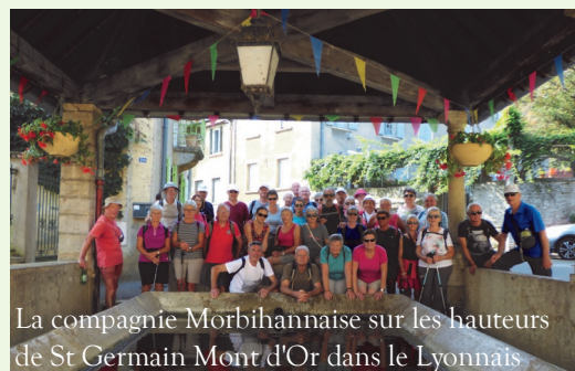
La compagnie Morbihannaise sur les hauteurs de St Germain Mont d'Or dans le Lyonnais