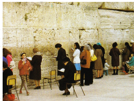
Le Mur des Lamentations